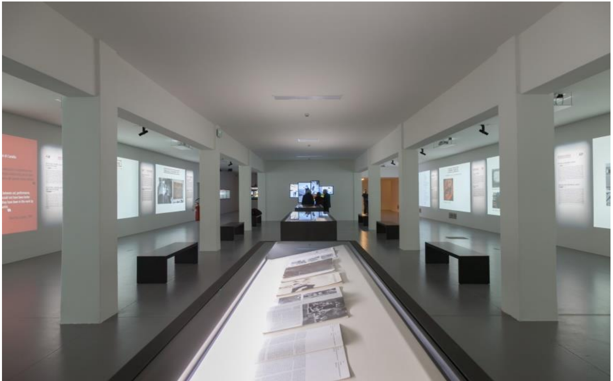
BURRIDOCUMENTA (Area Multimediale Documentaria)